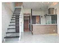
アイランドキッチン