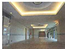
マンション入口エントランス