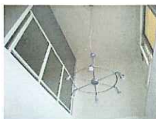
リビングは吹き抜けです