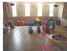
キッズルーム完備