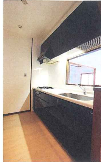
カウンターキッチン