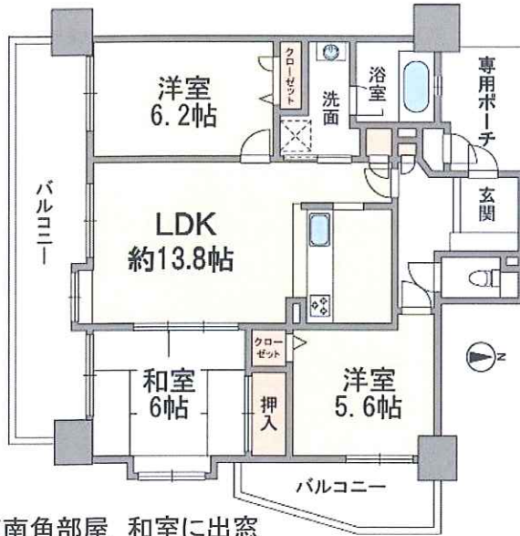
東南角部屋 和室に出窓