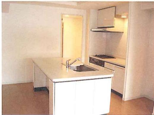
アイランドキッチン