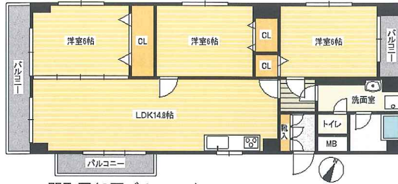
間取図(3面バルコニー)